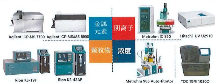
（图 4 半导体材料关键质量属性测试）

公司现有科研用房面积约 1900 m 2 ，实验室配备了价值 1000 余万元的测试金属元素、阴离子、颗粒物、浓度等指标的先进仪器设备约 50 台(套)，如：ICPMS-8900、ICPMS-7900 等等，配置半导体材料关键质量属性测试设备。同时设有江苏省集成电路用化学新材料工程技术研究中心、苏州市工程技术研究中心、昆山市重点实验室等研发机构。