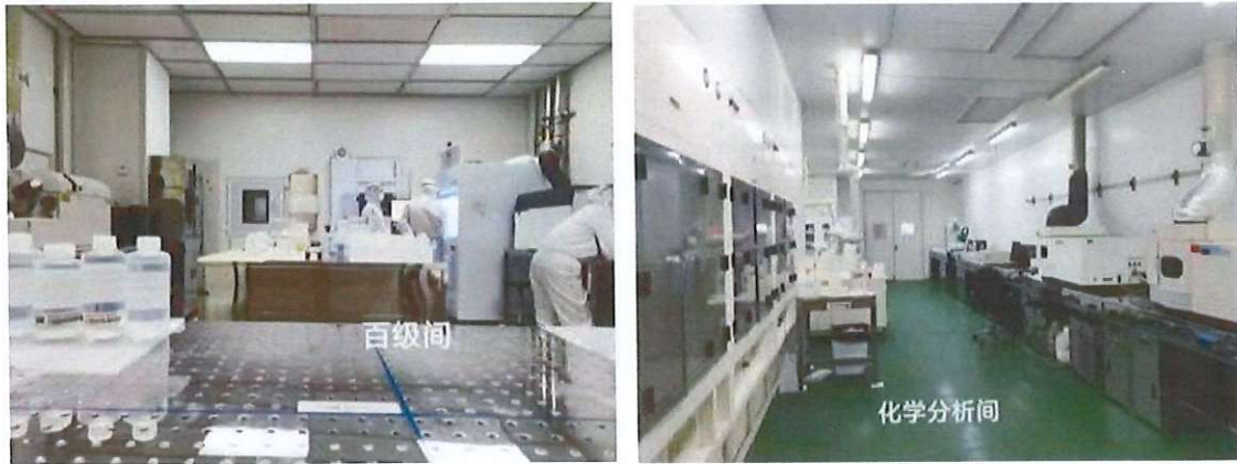
(图5 公司百级间及化学分析间)

产品的品质保证外，也提供电子和环境产业顾客的分析服务。工作站研究生可以利用公司生产经营有关的生产系统、辅助生产系统和配套设施进行技术研发。